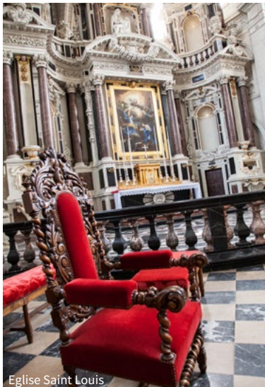
Eglise Saint Louis