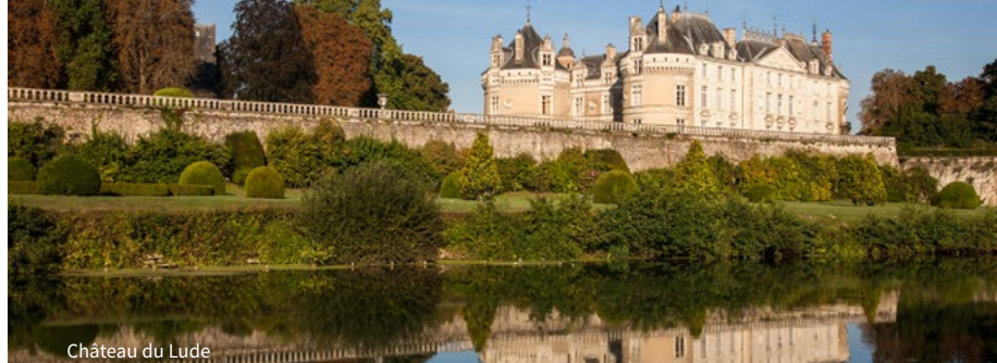
Château du Lude